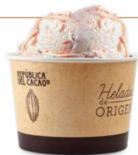
CHOCOLATE BLANCO con MANDARINA