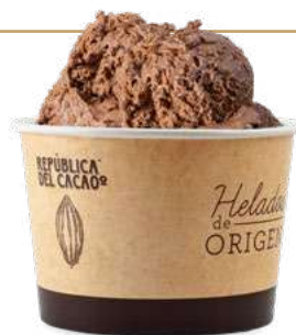
CHOCOLATE CON LECHE 40% CACAO