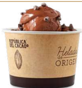
CHOCOLATE NEGRO AMAZONÍA 75% CACAO