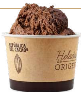
CHOCOLATE 56% CACAO con FRAMBUESAS