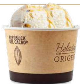
CHOCOLATE BLANCO con MARACUYÁ