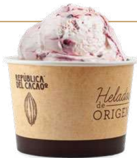
CHOCOLATE BLANCO con FRUTOS ROJOS