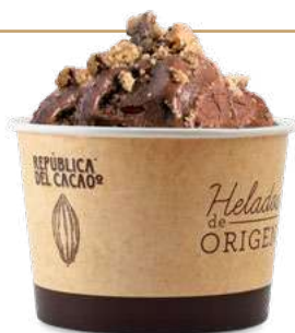
CHOCOLATE CON LECHE con NUECES