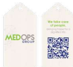
Tarjetas personalizadas con tu mensaje y logo