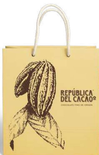
Bolsas Premium para tus pedidos