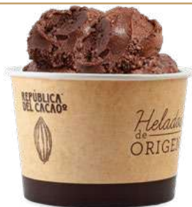
SORBET DE CHOCOLATE NEGRO 70%