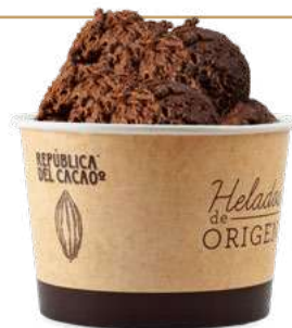
CHOCOLATE NEGRO 100% con LECHE